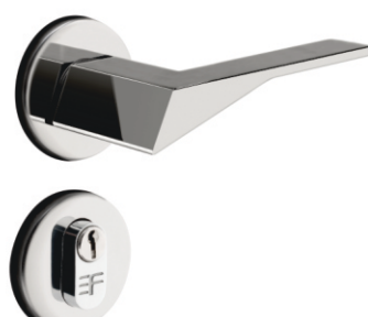
INOX 720E128 ZAMAC 721E128