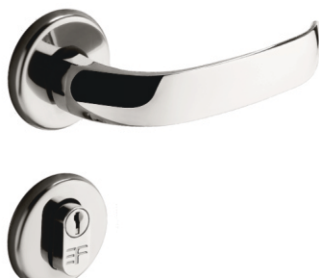
INOX 720E116 ZAMAC 721E116