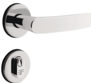
INOX 720E113 ZAMAC 721E113