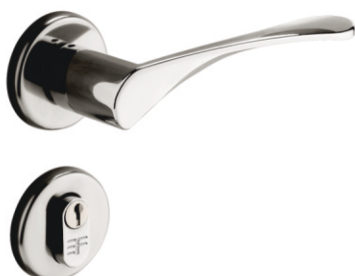
INOX 720E119 ZAMAC 721E119