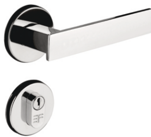
INOX 720E117 ZAMAC 721E117