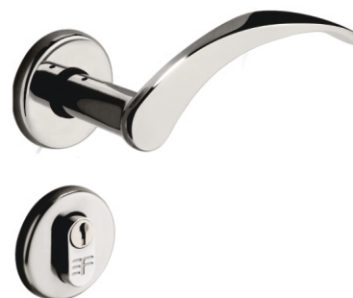
INOX 720E118 ZAMAC 721E118