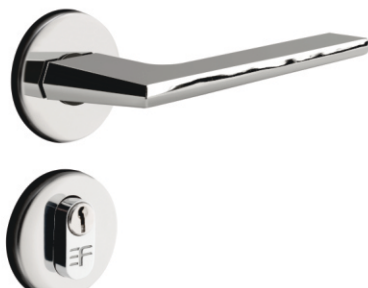
INOX 720E127 ZAMAC 721E127